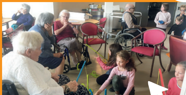
Animation avec l'EHPAD