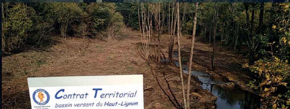
Recréation du cours méandriforme du Salcrupt (commune de St-Jeures) suite à la coupe de la plantation de résineux. Travaux réalisés en septembre 2019.

Les zones humides sont des milieux remarquables et jouent de nombreux rôles particulièrement importants pour la qualité des ruisseaux, le soutien des débits en période sèche, la faune et la flore, le paysage... Les fonctionnalités des zones humides sont reconnues, pourtant, deux-tiers des zones humides ont disparu en France depuis le début du 20 ème siècle, dont la moitié depuis 1960.