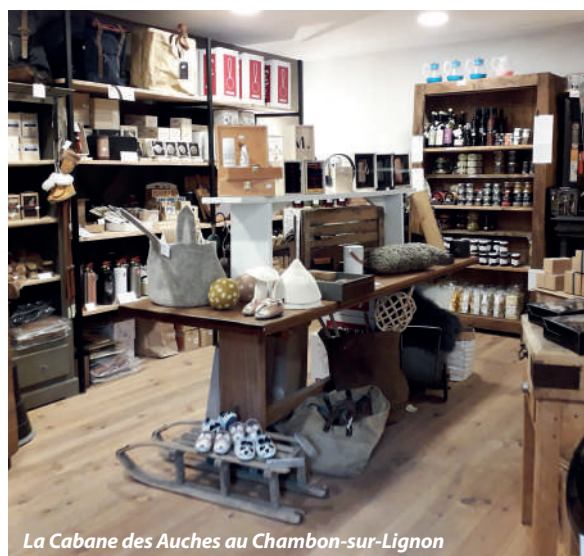
La Cabane des Auches au Chambon-sur-Lignon