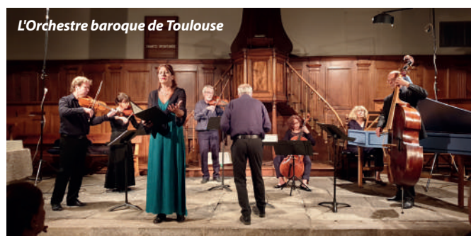
L'Orchestre baroque de Toulouse

Des émotions intenses avec les jeunes talents du Promesse quintet, des duos Hors des sentiers battus, Cordes et Parchemins, du concert en famille et les découvertes de Couleurs et résonnances, 2pi Airs sans oublier le Duo Russe qui fit partager sa musique enjouée aux