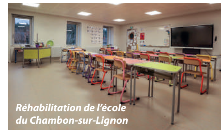
Réhabilitation de l'école du Chambon-sur-Lignon