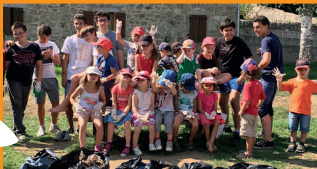
Nettoyons la ville de Tence