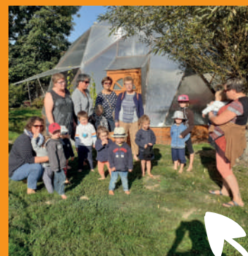
Relais Petite Enfance