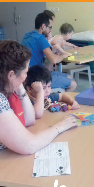
Ludothèque Le Ribambelle