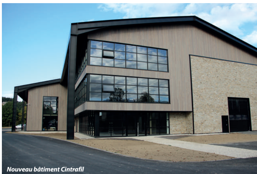
Nouveau bâtiment Cintrafil