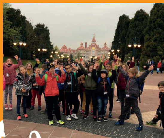
Camp à Disneyland Paris.