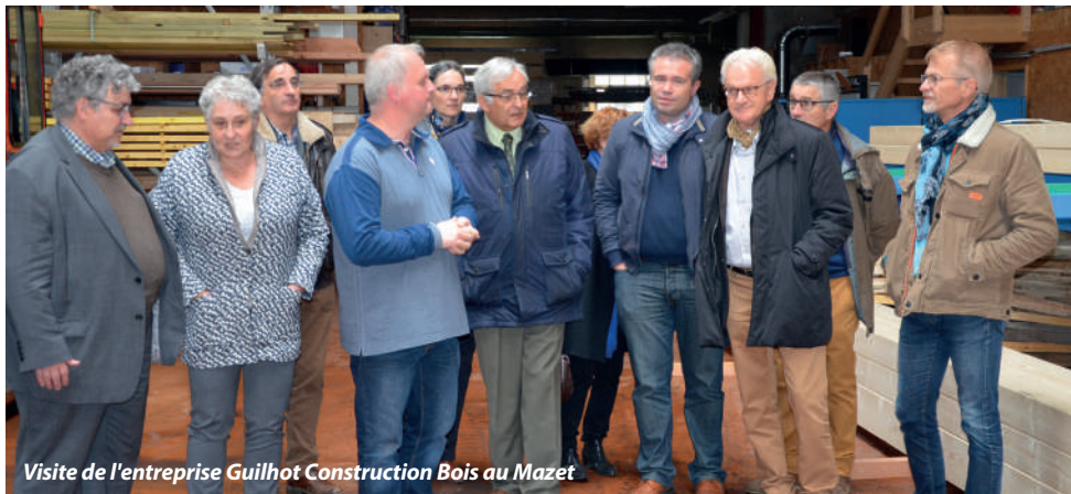
Visite de l'entreprise Guilhot Construction Bois au Mazet